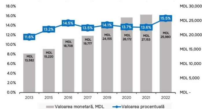
Figura 2. Dinamica inegalității de gen în salarii, în Republica Moldova, în valoare monetară și %

ESTE NEVOIE DE O INFORMAȚIE COMPLETĂ PRIVIND SCHIMBAREA NUMELUI DISPONIBILĂ PE PAGINA ASP